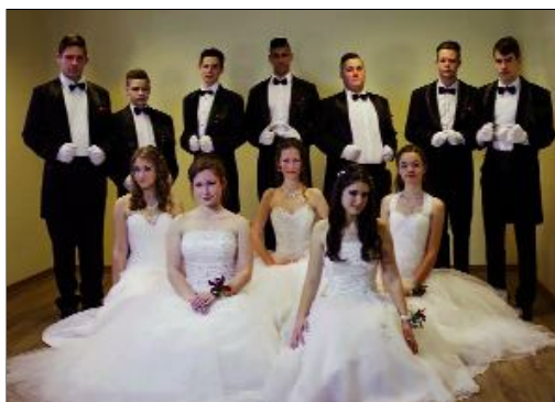
A farsangoló 8. osztály