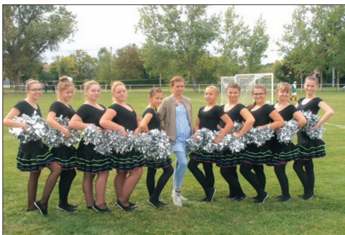
CSIRIBIRI MAZSORETT CSOPORT