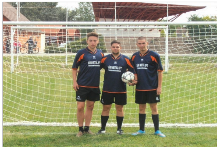
A HÁROM JÁTÉKEZŐ