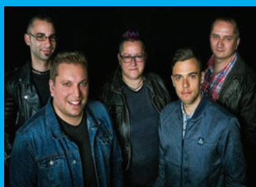
Dirty Slippers zenekar 20.00 óra