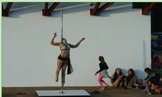
PHESZIRÁZ FITT STÚDIÓ kicsik és nagyok