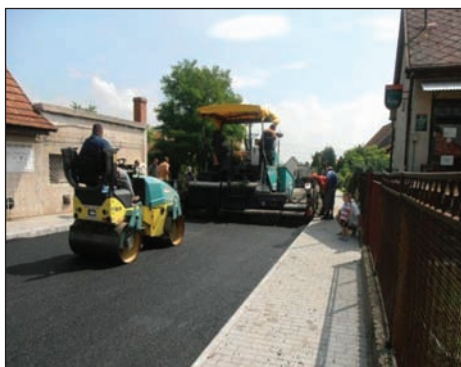
Elkészült Szabadság és Dózsa György utca