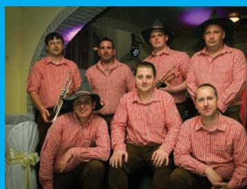
Gerecse Party zenekar 21.00 órától