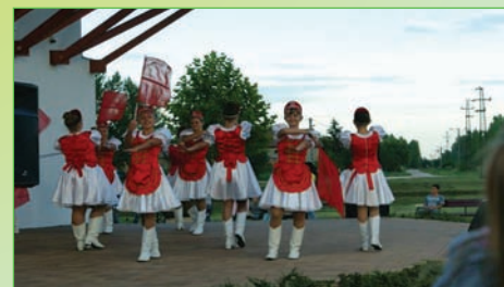
CSIRIBIRI MAZSORETT CSOPORT kicsik középsősök és nagyok